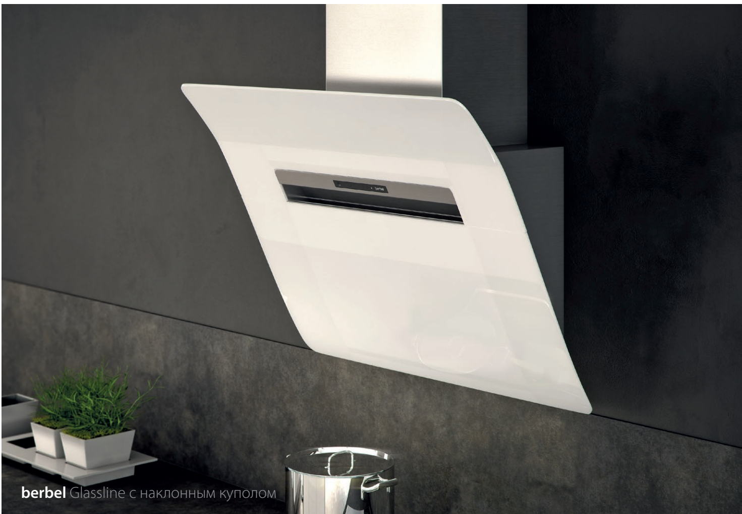
berbel Glassline с наклонным куполом